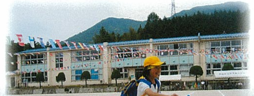
廃校前の石見東小学校 (平成17年 5月撮影)

敷地面積 : 6,669.28㎡ 定格出力 : 340kW 連系電圧 : 6,000V 連系申込日 : 平成24年 8月15日 設備認定日 : 平成24年 9月 3日 発電開始日 : 平成24年12月 5日 (予定) 太陽電池 : パワーコム社製 (中華民国) 1,428台 パワーコンディショナー : 新電元工業株式会社 (日本)